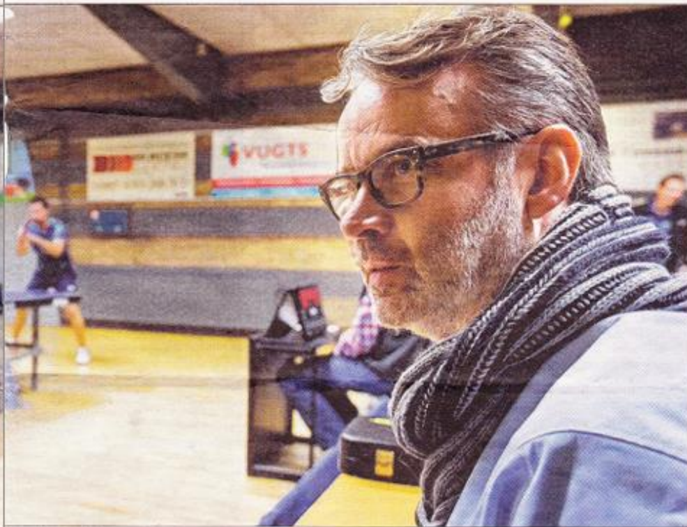
het Veghelse TTCV/Van Herwaarden.